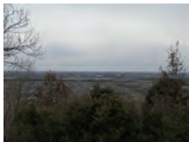
① 三井山山頂からの眺望