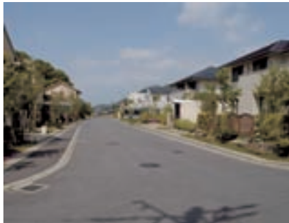
▲グリーンランド柄山景観地区 平成21年撮影 ※住宅地を対象とした景観地区は、全国に1例あるが、新たな建築行為を抑えた分譲住宅地を対象とした景観地区指定は全国初