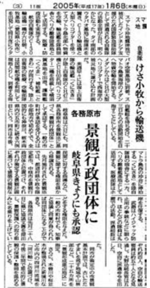
(平成17年1月6日付 中日新聞)