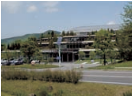
▲テクノプラザ景観地区 平成21年撮影 ※東海4県下で初の指定地区