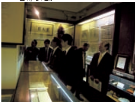
▲視察状況(日本の女優第一号川上貞奴が建立した貞照寺の宝物殿) 平成19年撮影