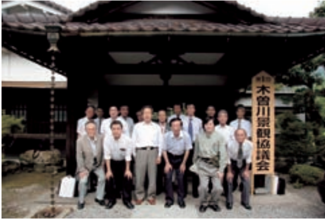
▲木曾川景観協議会設立記念写真(平成17年8月5日 旧川上別荘前)