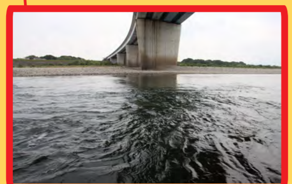
渦が巻いている場所