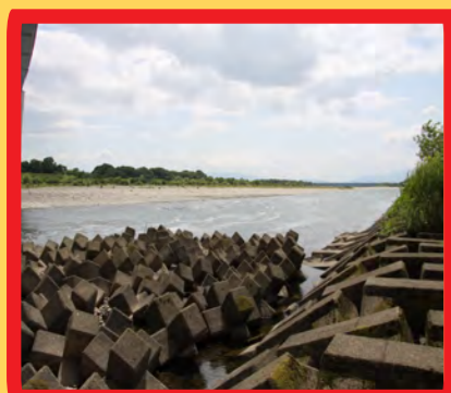
消波ブロックがあり危険な場所

ちいさい子は、おとなといっしょに見てね。 下の地図は、木曾川の中でも特にきけんなところです。 X は、事故があったところ、 ⊗ は、水を吸い込んでいるところ。 どちらも、とても危険です。 ぜったいに近づかないでね！