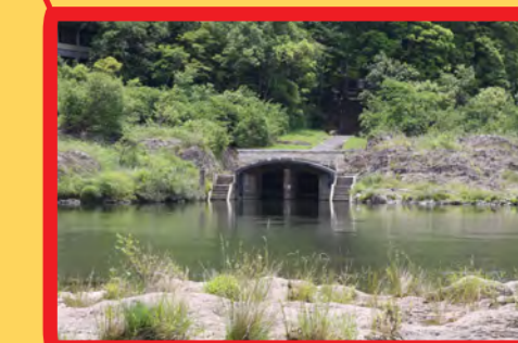
名古屋市上水道取入口