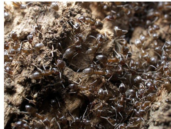
アルゼンチンアリのコロニー

アルゼンチンアリによる被害拡大防止には、地域の皆様の団結が必要です。互いに情報を交換し効率的な防除を実施しましょう。