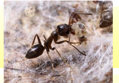
幼虫を運ぶ「働きアリ」

働きアリが幼虫を運びながら巣を拡大していきます。年間100m～200m程度拡大するといわれています。日常の駆除で拡大を食い止める必要があります。