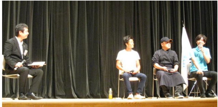
↑クロストークの様子。