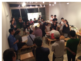
昨年（2017年）の第1回目。さまざまな活動をしているセンパイの話聞き、地域課題に対してやってみたいことを考えました。