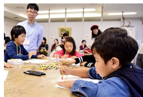
企画を実施。子どもたちが地域の方と共にアートの場に参加する環境を目指し、コースター作り。コースターは市内飲食店で配布され、メディアにも取り上げられました。