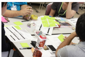
昨年（2018年）の第2回目。共感できる人同士のグループに分かれ、課題を深掘り、できることを持ち寄って企画を練りました。（今年度は実施までに2回を予定）