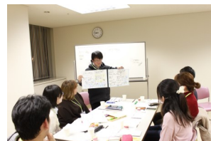
最後には振り返り。取り組みの中での感想、反省点、今後に向けての意見を出し合いました。1回のイベントで終わらず、次のまちづくり活動を目指しています。