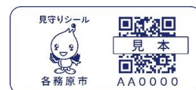
見守りシール見本