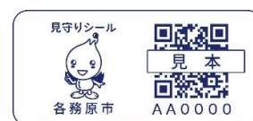
見守りシール見本