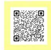
▲協力店に関する情報はこちら