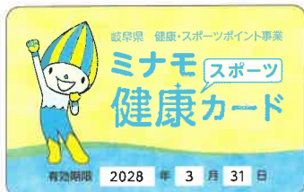
▲ミナモ健康スポーツカード