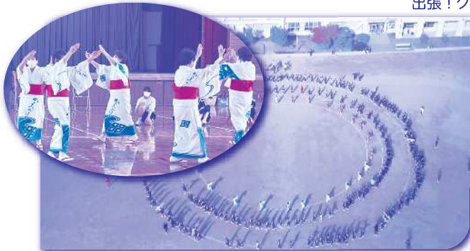
出張!クラブ・サークル 27|28|29