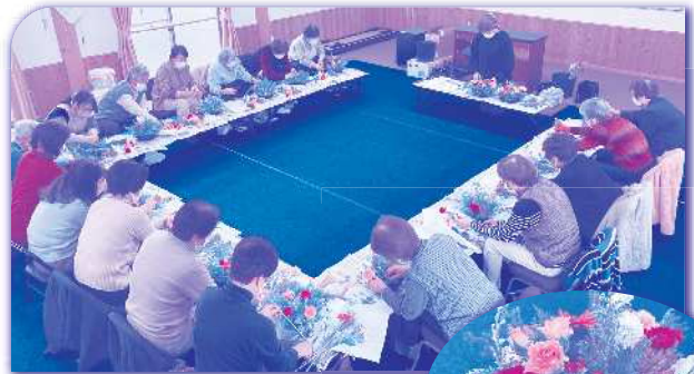
出前講座(登録講師) 128