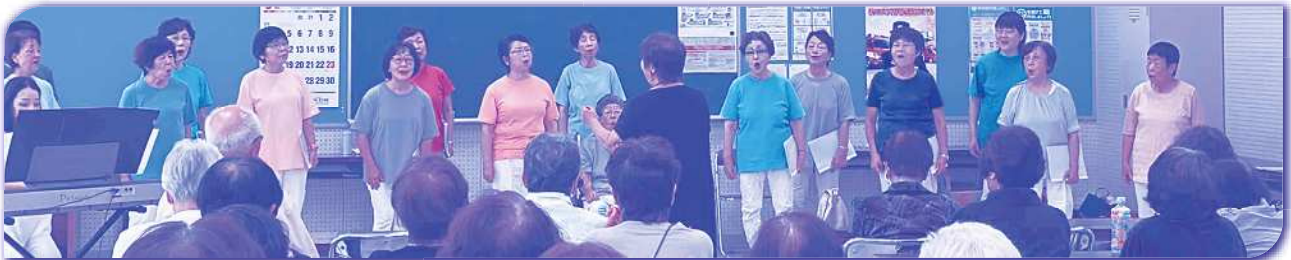
出張!クラブ・サークル 1