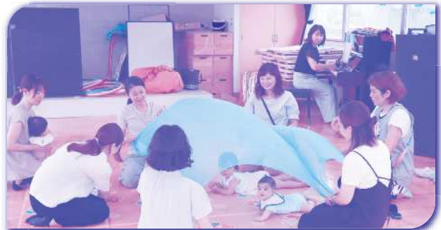
出前講座(登録講師) 109