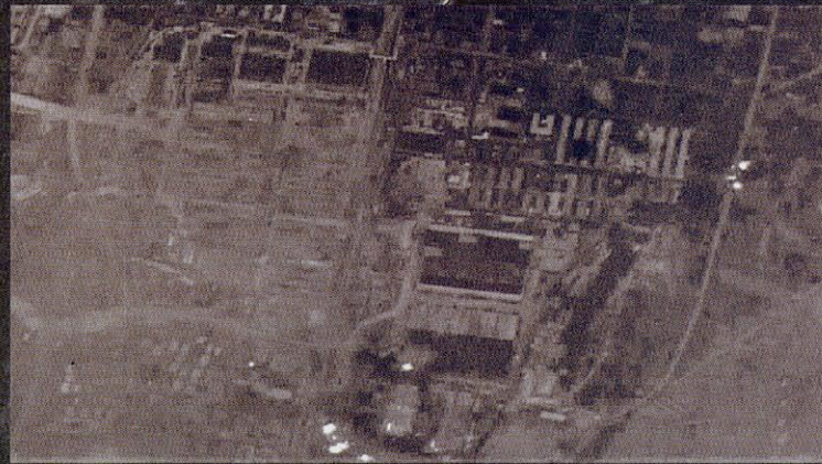
昭和 20 年 6 月 26 日 B-29 による川崎航空機岐阜工場への爆撃