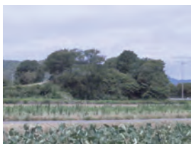
③ 伝蘇我倉山田石川麻呂の墓