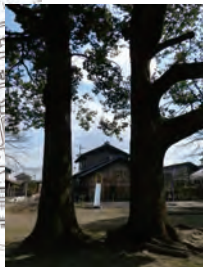
③ 神明神社の夫婦楠