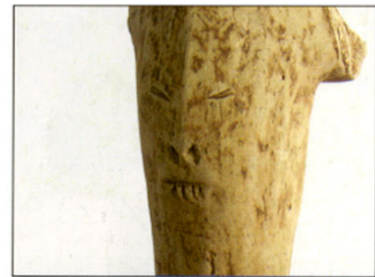
獣脚付火舎の一部