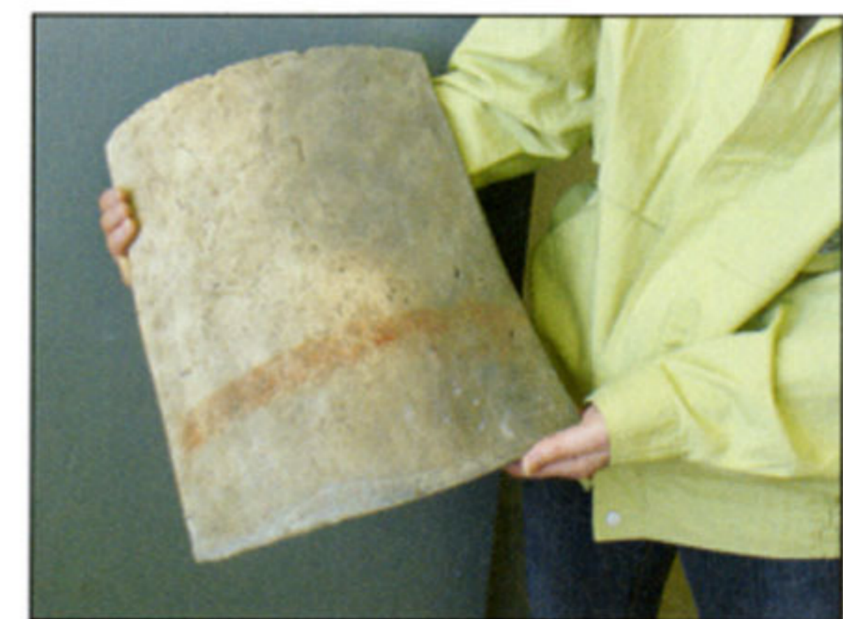
朱が付着した軒平瓦

今年度、山田寺跡第四次範囲確認調査を実施しました。これで山田寺跡の調査は終了となります。