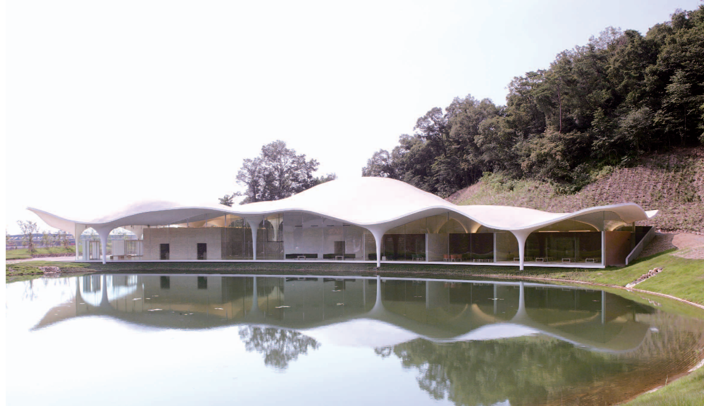
瞑想の森 市営斎場 Meisou no mori Municipal Funeral Hall