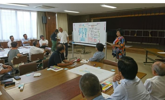
班の代表者による発表