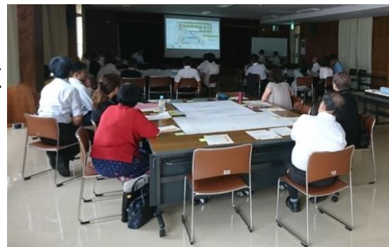
他市庁舎の事例の紹介