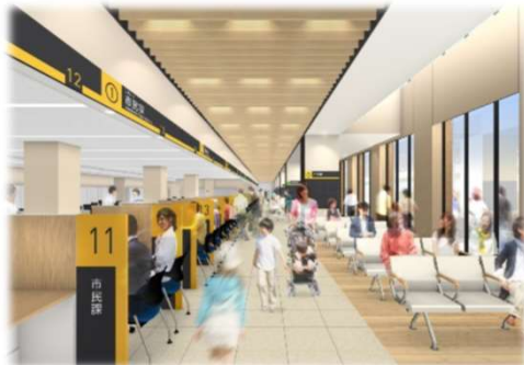
1階窓口イメージ図

現庁舎では9月17日(金)まで業務を行い、18, 19, 20日の3連休で新庁舎への移転を行い、21日(火)に新庁舎での業務を開始します。各階に配置される課は以下のとおりです。