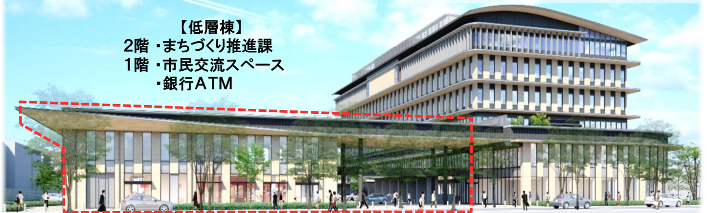
新庁舎全面完成イメージ図(西側)