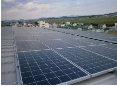
太陽光発電パネル

屋上に設置した太陽光発電パネルにより、新庁舎全体のエネルギー消費量を大幅に削減します。