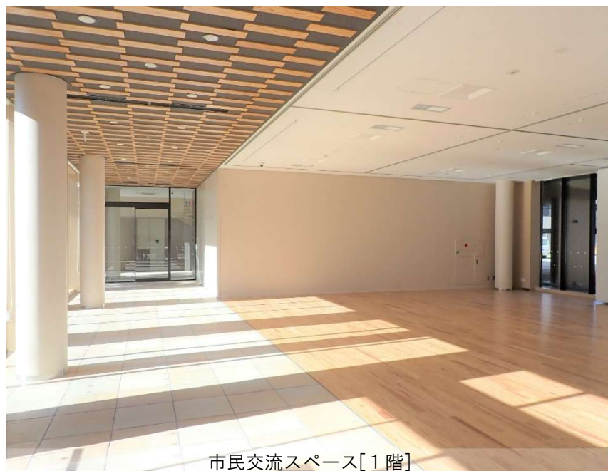
市民交流スペース[1階]

平成26年度に庁舎の建替の方針を決定してから進めていきました新庁舎建設事業ですが、この度、令和5年11月6日の全面オープンをもちまして事業完了となります。工事期間中、ご迷惑やご不便をお掛けいたしました事深くお詫び申し上げます。長期間にわたり多くの皆様のご理解とご協力をいただき、誠にありがとうございました。ごさいます。