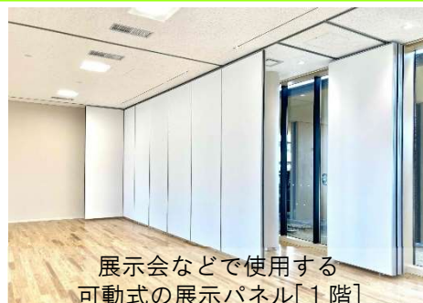
展示会などで使用する可動式の展示パネル[1階]

●岐阜県産木材の活用 新庁舎低層棟1階の一部天井の木パネルと床フローリング材は、岐阜県産材の木材の需要拡大を図ることを目的とする「ぎふ県産材利用促進施設等整備事業」という岐阜県の補助金を活用して整備しています。低層棟1階は木材を多く利用した落ち着いた空間になっています。