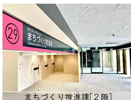
まちづくり推進課[2階]

●まちづくり推進課[2階] 自治会、まちづくり活動、市民相談に関する業務を行う部署です。相談室を3部屋整備しています。 ※11月6日に産業文化センター16階から新庁舎低層棟2階に移転します。