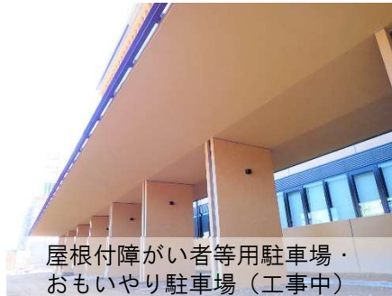
屋根付障がい者等用駐車場・おもいやり駐車場(工事中)

●身体障がい者等用駐車場の7台、おもいやり駐車場の8台あります。いずれも雨や雪に濡れずに市役所出入口までアクセスできる屋根付きの駐車場です。