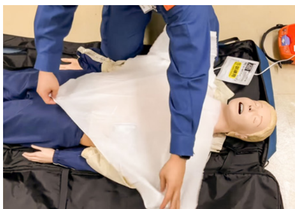
救命措置とともにプライバシーに配慮