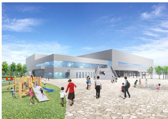
新総合体育館の完成イメージ