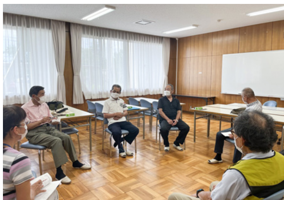
地域の情報交換の場となる「わがまち茶話会」

今後の課題は、多様な意見を伺うため、地域活動の裾野をさらに広げていくことである。