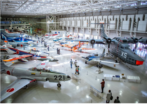
数多くの機体が展示される空宙博

答 本市の代表的な観光資源の一つである岐阜かかみがはら航空宇宙博物館（空宙博）は、本格的な航空と宇宙の展示を兼ね備えた専門博物館である。リニューアルから約4年間で100万人が来館するなど、そのポテンシャルは非常に高いものがあると考えている。