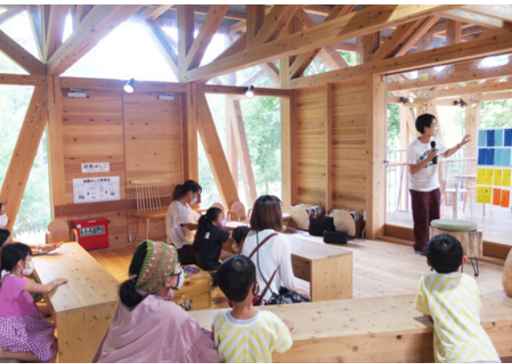
ことばを楽しく学ぶ子ども向けワークショップ

例えば「短歌」を題材にした親子参加型の講座や「現代俳句」に焦点を当てたワークショップを財団が実施しているほか、本市でも、これまでに夏休み子ども