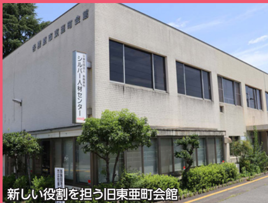
新しい役割を担う旧東亜町会館