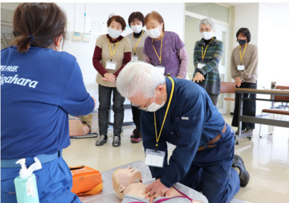
地域の支え合い活動を担うサポーターを養成

ただし、住民主体による支援活動については、あくまでも住民の意思により、無理のない範