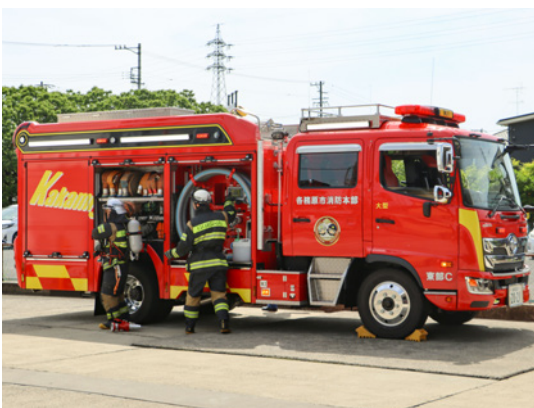
川島分署にも配備予定の水槽付消防ポンプ自動車

また、四輪駆動やAT車にすることで、高い走破性と緊急走行時の安全性を向上させる。