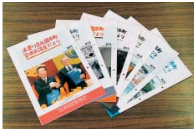
「協議会だより」のバックナンバー

合併協議の内容については、協議会だよりを発行して、皆さんにご報告をしています。今までに発行したバックナンバーは、会議資料や会議録とともに閲覧できるだけでなく、窓口で配布しています。各務原市役所4階合併推進室または川島町役場4階企画調整課にお立ち寄りください。