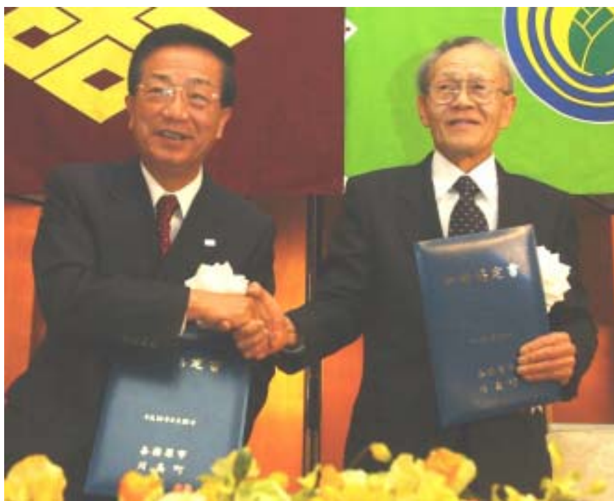
調印後、両市町長が握手