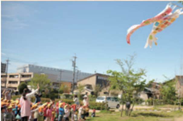
市内保育所「こいのぼり揚げ」

このこいのぼりは、年長・年中の園児82人で協力して作成。うろこ型の画用紙に、「自分の顔」を描いて、貼り付けました。参加した園児は、「自分の似顔絵が上手に描けました。家のこいのぼりより大きくて、楽しい!」とはしゃいでいました。