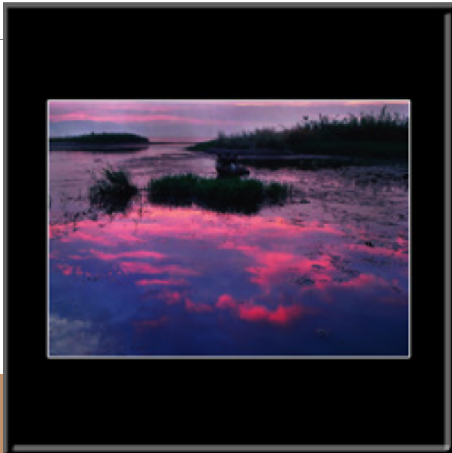
写真 にお うた 琵琶湖「鳥の詩」