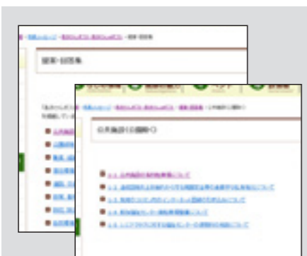
▲ウェブサイトの「提案・回答集」の画面