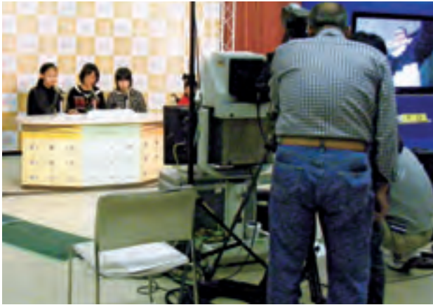
キミが主役だ！ NHK 放送体験クラブ