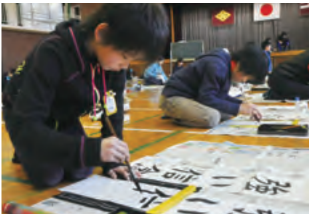
那加第二小学校「書き初め大会」