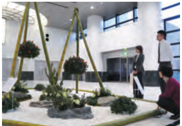
迎春ガーデニング