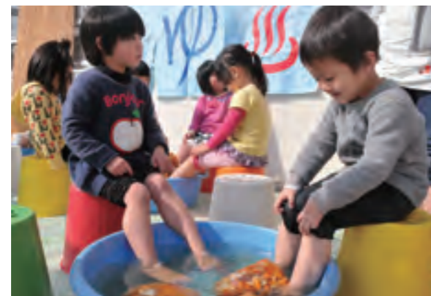
蘇原保育所「足湯体験」

ネットに入れたミカンの皮を、たらいに張ったお湯に入れると、湯気と一緒にミカンの匂いが広がります。「いい湯だな」の曲も流れる中、湯に足を入れた子どもたちは、「あったかぁーい」「きもちいい!」とみんな笑顔。足で皮をモミモミする子もいて、お湯も、ほんのりミカン色になりました。心も体もあたたまる、素敵な体験をした子どもたちでした。