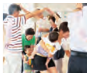
ばあば・じいじとあそぼう

●ばあば・じいじとあそぼう 子育て応援団「ばあば・じいじ」と一緒に遊んだり、歌ったりと楽しい時間を過ごしましょう。