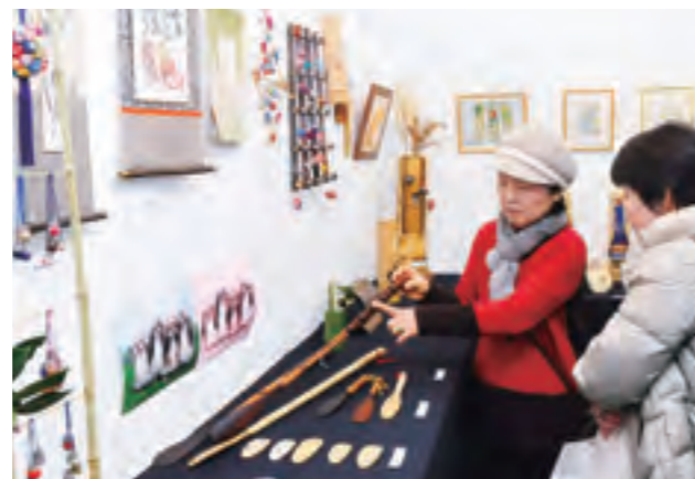
NPO 法人竹林救援隊の初作品展

出展された壁掛けや各種インテリア、おもちゃなどは、どれも竹の魅力がにじみ出る素敵な作品。日ごろから放置竹林などの整備や、各種イベントで竹細工の指導をするなど、竹を愛し、その良さを知ってもらう活動を行っている救援隊の皆さんの気持ちあふれるものばかり! 来場者は「よくできているわねえ」と感心しきりで、作品や竹談議でもりあがる和やかな展示会となりました。(2月21日)