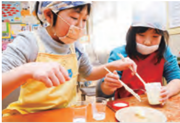
緑苑小「食育出前授業」