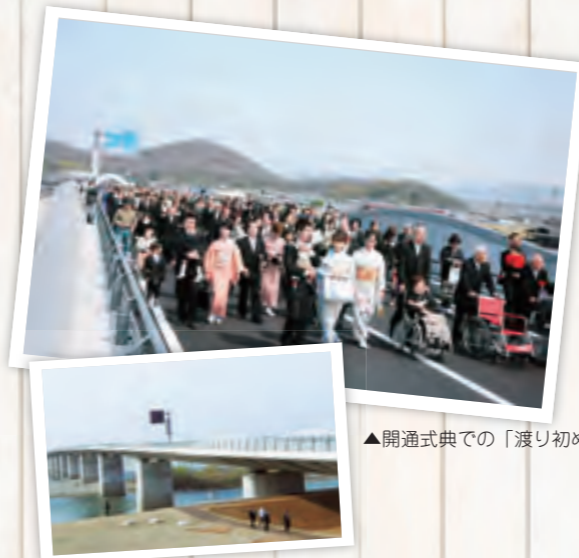
▲開通式典での「渡り初め」

1年間連載してきた「写真で振り返るかみかみはらの50年」も今号で最終回。最後は「各務原大橋の開通」です。約1年前の平成25年3月24日、各務原大橋の開通記念式典が、各務原大橋の上で行われました。当日は穏やかな晴天に恵まれ、約2100人もの方が来場。市内三世代夫婦10組による渡り初めや、ギネス世界記録への挑戦も行われるなど、橋の完成を市民の皆さんと盛大に祝いました。 ※次号からは、表紙企画「各務原の匠」と連動する新コーナーが始まります