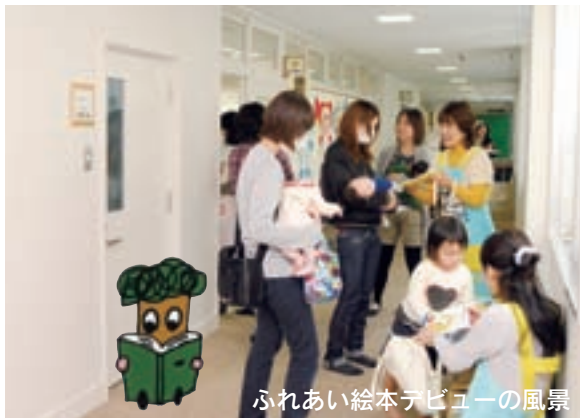
ふれあい絵本デビューの風景

開催場所 総合福祉会館・あさひ子ども館の4か月児健康診査会場 詳細 子育て支援課 ☎058(3383)1555