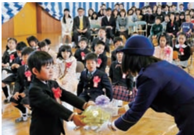
防犯ホイッスル贈呈式