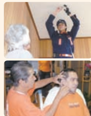
◀(写真上)住宅用火災警報器の設置 事業(写真下)理美容サービス事業

平成 22 年度に実施した「各務原市シビルミニマム」の主な事業の利用状況は下表のとおりです。