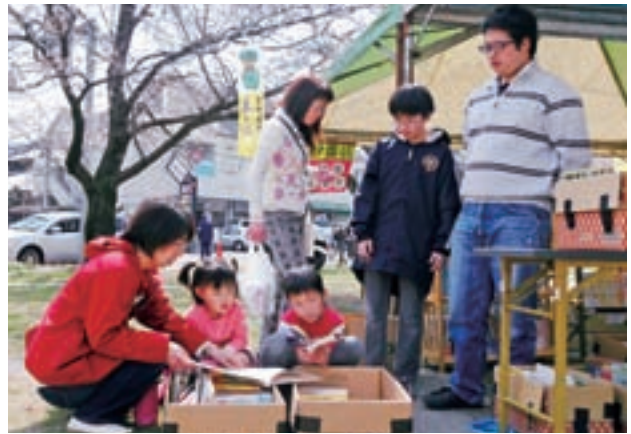
桜まつり 青空古本市

また、市民公園の東側では青空古本市が開催され、思い思いの本などを持ち寄った30の店舗が軒を並べました。立ち寄った人々は、暖かな日差しの下「あっ、この本いいな」とわくわくした様子でページをめくり、お店の人との会話も楽しみながら本の世界を堪能しました。(4月2・3日)