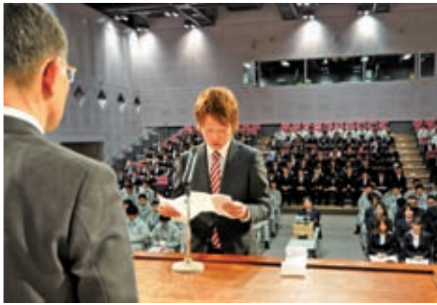
新就職者激励の集い