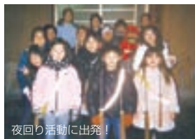
夜回り活動に出発!

A 地域の防火意識などが高まるだけでなく、子どもたちと地域の方との交流の場にもなっています。20年以上続けてきた活動です。今後も、地域の安心のため「夜回り活動」をしていきます。