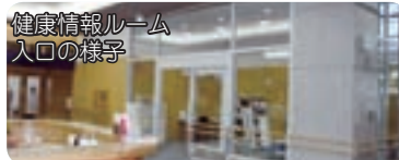
健康情報ルーム 入口の様子