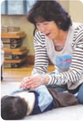
スタッフさんは子どもが大好き(ニコニコハート)

地域のつながりで、子育て中の親子をサポートする親子サロン。公民館やコミュニティセンターを会場に、地域の先輩ママや市民ボランティアの方が運営しています。今年4月現在、市内では6カ所の親子サロンが開設されています。