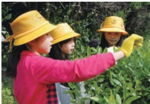
稲羽東小学校 茶摘み体験