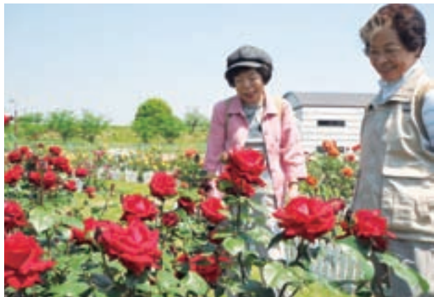
各務原浄化センター バラ園