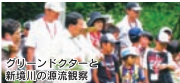
グリーンドクターと 新境川の源流観察

川、水にまつわる市内の施設などを巡り、各務原市の今を自分の目で確かめてみませんか。