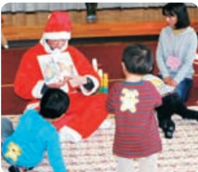
クリスマス会ではサンタクロースが絵本を読んでくれるよ(おひさま)