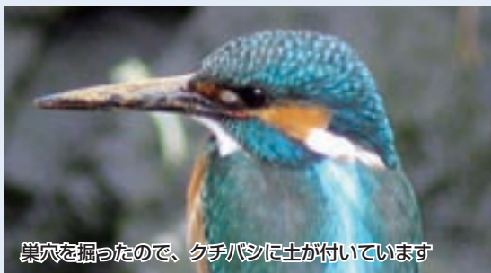
巣穴を掘ったので、クチバシに土が付いています

春から夏にかけてカワセミは子育て時期に入っています。カワセミは川など水辺の土手に1メートルほどの横穴を掘り、その中で子どもを育てます。しかし川の護岸整備の為に土手の多くはセメントで覆われ、カワセミの巣がつくれなくなってしまうことも原因でカワセミの姿を見られる場所は減少しましたが、近年は護岸された川でも、所々にある直径5センチメートル程度の水抜き穴を巣の代わりに利用し、子育てをするカワセミが見られています。