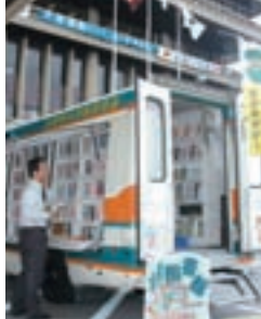
出前図書館の様子