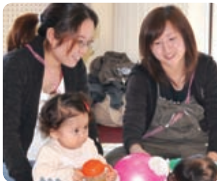
なごやかな雰囲気の中、ママのおしゃべりもはずみずみ(おひさま)