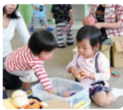
サークルでは、子どもたちが好きなおもちゃで自由に遊びます（MILK）

自由に遊ぶだけでなく、テーマを決めて親子でお絵かきや工作に挑戦するところや、季節ごとに、お花見やクリスマス会などのイベントすることもあります。