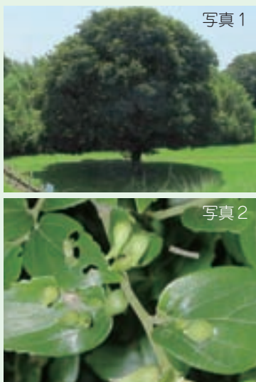
◀ (写真1) 木陰を作るエノキ (写真2) 虫こぶ (中に虫が入っている)