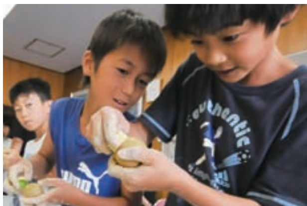
川島ライフ夏休み講座 どろだんごと塗り壁体験

泥を団子状にして磨き続けると、ピッカピカに光り始めます。約2時間、子どもたちは一心不乱に力を込めて磨き続け、空調の効いた室内でも汗びっしょりに。屋外では、本物の左官職人のコテを手に、緊張しながら1m四方の壁を塗り上げ、達成感を味わいました。モノづくりの精神や、日本に伝わる技術とのふれあいなど、楽しみながら学びの要素をいっぱい吸収した子どもたちでした。(8月11日)