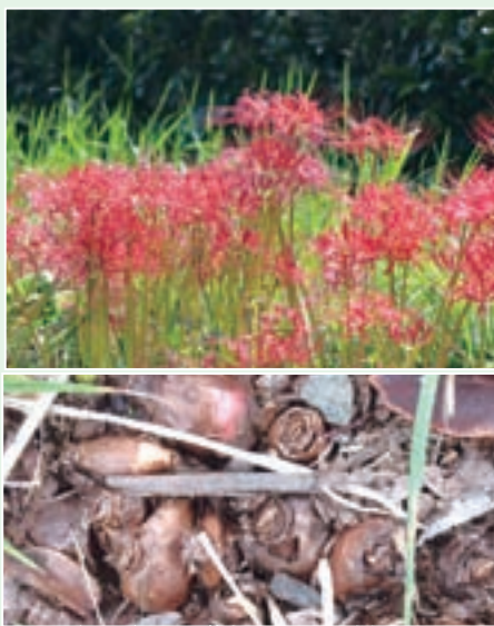
▲ヒガンバナの群生(上)と球根(下)

このヒガンバナに毒があることを知っている方は多いでしょう。この毒は「リコリン」といって、植物に含まれる有毒成分として知られる、アルカロイドの一種です。この毒は、花や葉だけでなく