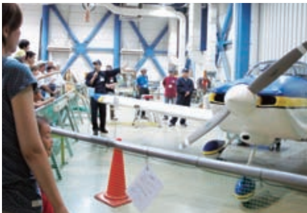
ホームビルド機「RV-6A」見学会