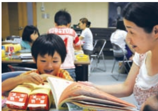
子ども手作り絵本教室

作業に入ると、好きな絵本のストーリーを参考にしたり、オリジナルイラストをクレパスやマジックで描いたりして、世界にたった一つの楽しい絵本を完成させました。(8月5日・川島ほんの家)