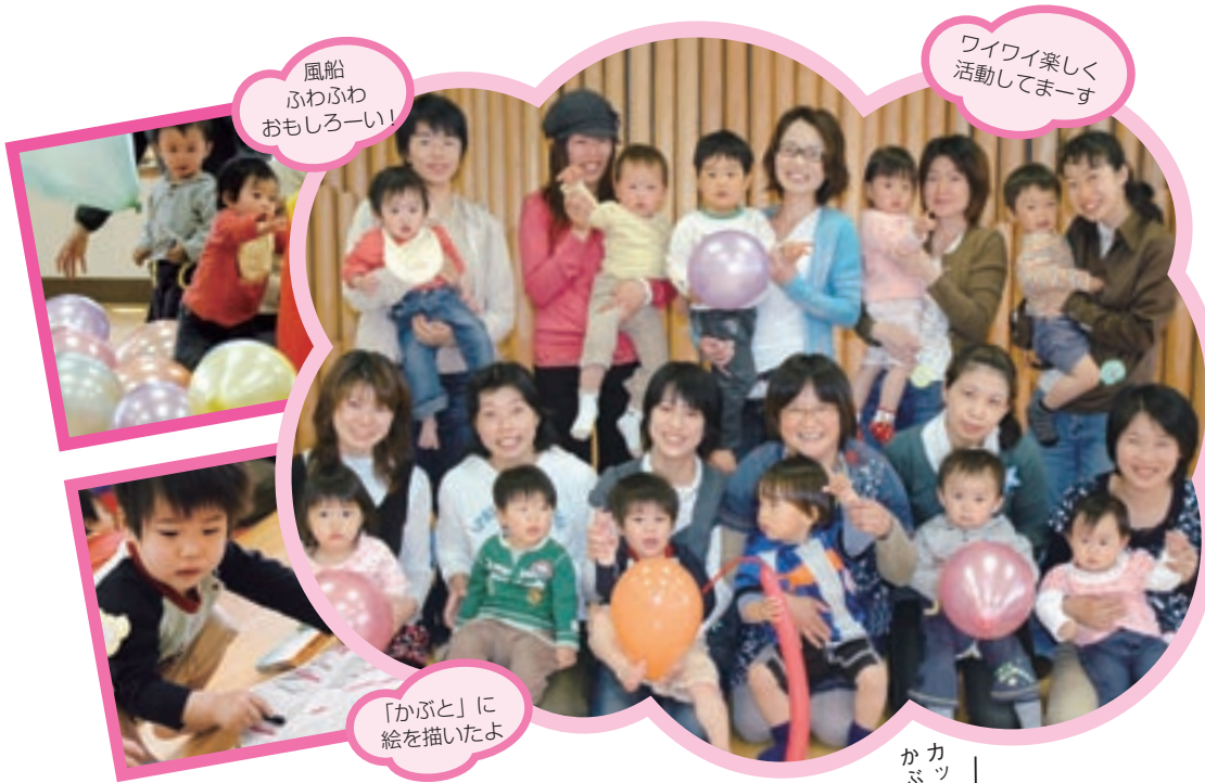
風船 ふわふわ おもしろーい!

「育児に自信がない」「大変な思いをしているのって私だけ?」 こんな悩みを持っている、ママやパパって意外と多いみたい。 そんなときは、気軽に子育てサークルをのぞいてみるといいかも!