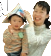
カッコいい かぶとでしょ

子育てサークル「ひなたぼっこ」さんに突撃取材しました! この日は、端午の節句にちなんで「かぶと」作りに挑戦。 そのほかにも、色とりどりの風船をしきつめて親子で一緒に遊ぶなど、みんなとってもイキイキ!!