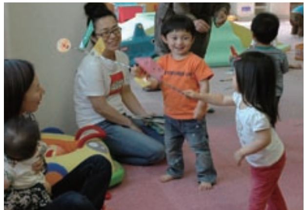
こいのぼりづくり