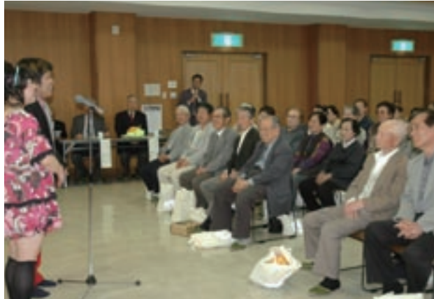
高齢者交通安全大学校