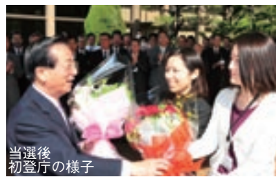
当選後初登庁の様子

4期目も、引き続き「元氣な各務原市」を強力に推進します。そのため、「人にやさしい都市」など6つの都市戦略を掲げ、さまざまな施策を積極的かつたくましく推進してまいります。