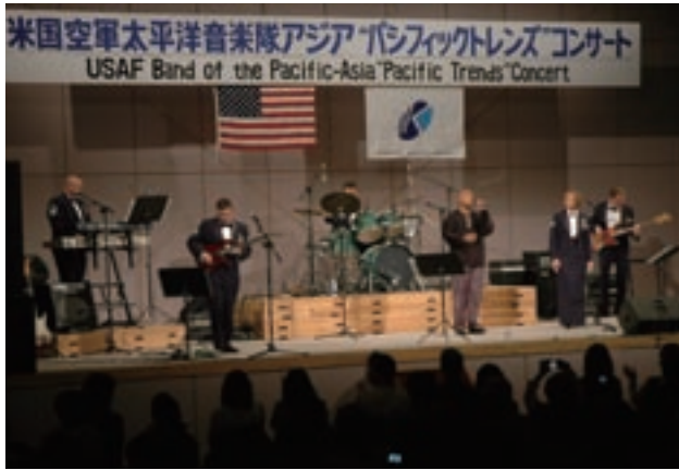
パシフィック・トレズコンサート