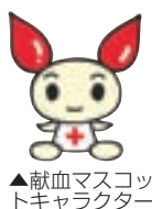
▲献血マスコットキャラクター