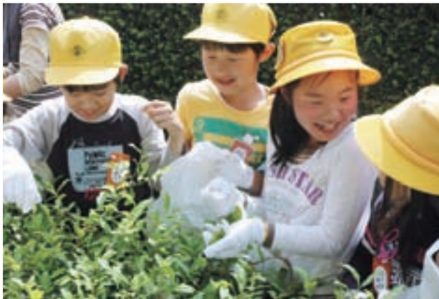
稲羽東小学校で茶摘み