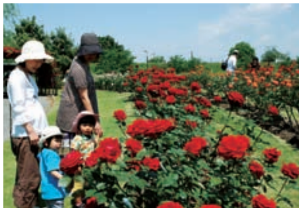
各務原浄化センターバラ園