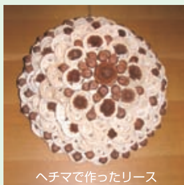
ヘチマで作ったリース

もう一つ珍しい利用方法をご紹介します。 熟した果実を輪切りにし、漂白剤に着け果皮 を柔らかくします。柔らかくなった果皮を取り 除くと白い繊維質の部分だけが残ります。 この部分はリースの飾り付けや工芸の材料と して利用でき ます。皆さん のアイデア で、ヘチマの 利用方法の幅 が広がります。 色々と工 夫をして、ヘ チマを楽しん でみてはいか がでしょうか。