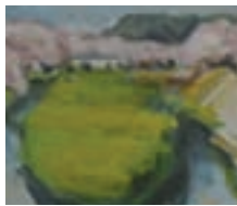
「春望(新境川の桜)」 横山潤之助