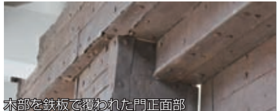
木部を鉄板で覆われた門正面部