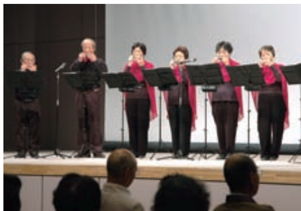
ライフカレッジ・ハイカレッジ開講式

式典の後、アトラクションとしてハーモニカのサークル「はまなす」の演奏と、「みんなのマジックがかみがはら」によるマジックショーが開催され、参加した受講者がハーモニカの演奏に合わせて歌を口ずさむなど、和やかな雰囲気の中で講座がスタートしました。 (5月8日)