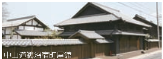
中山道鵜沼宿町屋館

日時 土、日、祝日の午前9時～午後4時（平日でもガイド在中時にはご利用いただけます） 申込と詳細 歴史民俗資料館（中山道鵜沼宿町屋館内） ☎ 058-379-5055