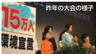
昨年の大会の様子

昨年開催した「環境行動都市市民推進大会」。その中で発表された「15万人環境宣言」を受け、市内の家庭や地域、企業・事業所で、レジ袋の削減(有料化)、紙ごみ、緑ごみの再資源化など、地球温暖化防止への取り組みが着実に前進しています。