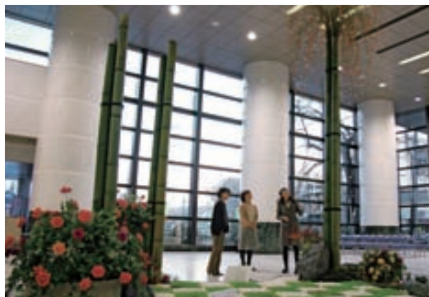
迎春ガーデニング

訪れた人たちは「どうやって生けてあるのかしら」「このかわいいお花は何かしら」と興味津々。つい足を止めて作品に見入っていました。(1 月 4 日~14 日)