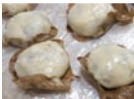
▲郷土菓子「がんどぼち」

有料の飲食コーナーでは、郷土菓子「がんどぼち」や各務原キムチ鍋、皆楽座特製弁当など郷土の味覚を味わうことができます。