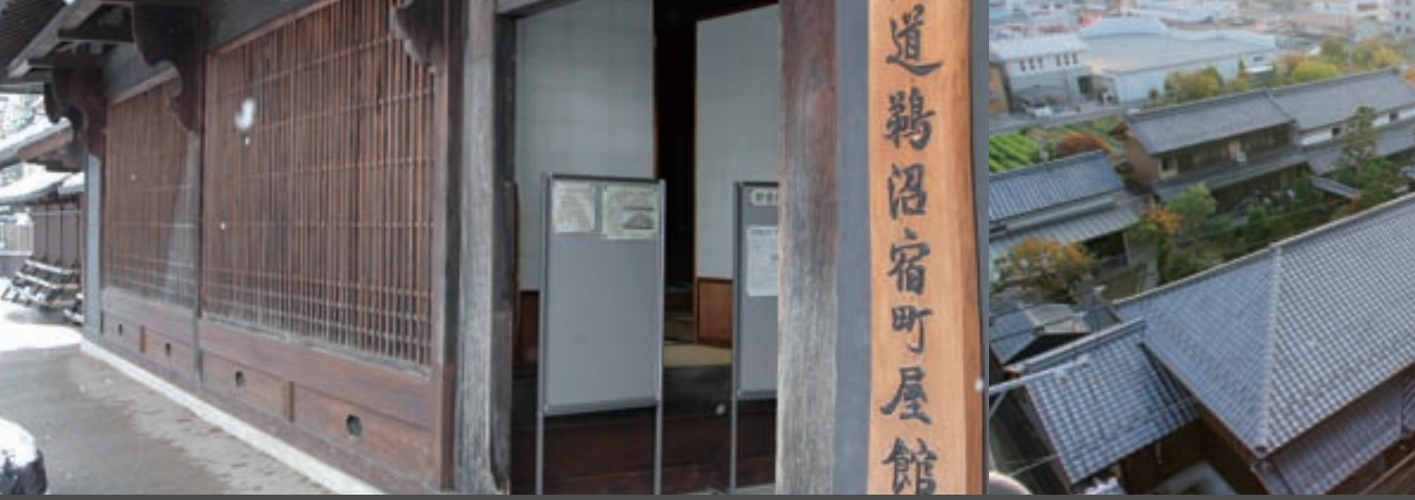
(写真左) 江戸時代に旅籠 はたご だった建物を改修した中山道鶴沼宿町屋館 (写真右) 歴史的な建物が続く中山道鶴沼宿の街並