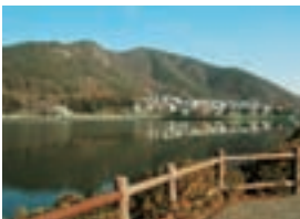
▲ウォーキングする人も多いおがせ池

市では、この歴史街道により多くの方が親しんでもらえるよう、3ページでご紹介する「新酒ガーデン」やウォーキングツアーなどのイベント、また、「おがせ池」のようないち帯地グルメの発掘など、PR活動を行っていきます。