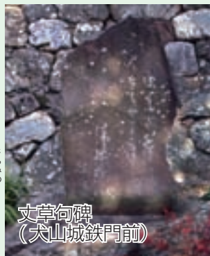
文草句碑 (犬山城鉄門前)

芭蕉の弟子となり、たちまち蕉門に認められた文草は、元禄4年（1691）に上梓された蕉門の最高峰の句集であるとされる「猿蓑」に12句を入集しました。またその終わりに記す文章である跋文を書いて注目を集めました。