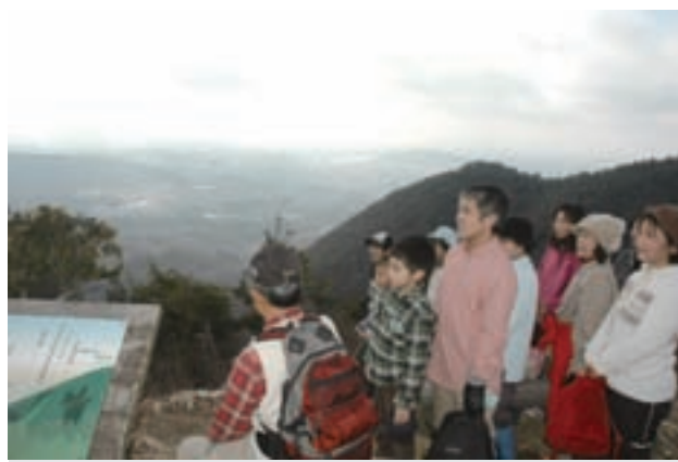
各務原アルプストレッキング

自然遺産の森を出発し、明王山(標高 380 m)と金比羅山(383 m)が目的地。急斜面や、岩場などもあり、初めは元気だった皆さんも、だんだん息遣いも荒く、汗が滴り落ちます。写真は明王山の頂上展望台。御嶽山や木曾川など、すばらしい眺望に疲れも吹き飛び、笑顔がこぼれます。下山後は、心地よい疲労感のなか、皆で豚汁も楽しみ、心もお腹も大満足の講座となりました。(1 月 10 日)