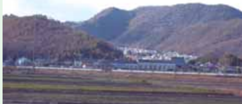
うばがふところ遠景

乳母はやがて三峰山の麓にたどりつき、そこでとうとう歩けなくなりました。すると、近くで水の流れる音が聞こえてきました。谷から清水が湧き出ていたので