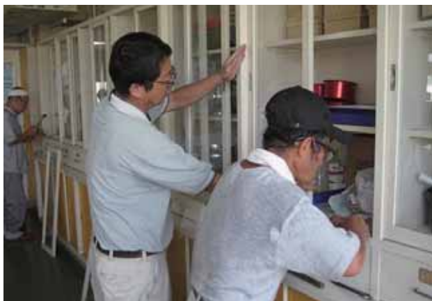
建具修繕ボランティア