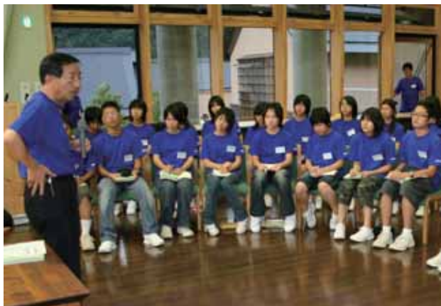
夏季各務野立志塾