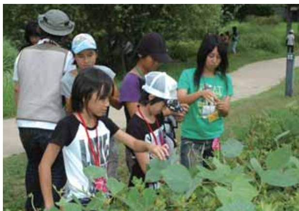
小学生交歓交流会

最後に交流カードにお互いの住所やメッセージを書き込んで交換し、今後の交流を約束しました。