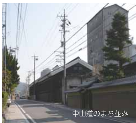
中山道のまち並み

この中でも、特に中山道鵜沼宿は市にとって重要な歴史資源です。国土交通省のまちづくり交付金を活用し、平成18年度から5カ年計画で整備しています。具体的には、5月24日にオープンした中山道鵜沼宿町屋館、今年度から着手する脇本陣の復元などを計画しています。