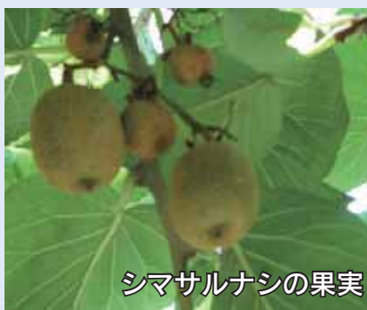
シマサルナシの果実

マタタビ科の植物の一つにキウイフルーツがあります。日本原産とされるシマサルナシが中国で改良され、これがニュージーランドに渡り更に改良され、現在のキウイフルーツとなりました。