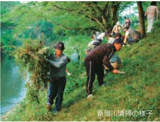
新境川清掃の様子

をはじめ、いくつかのメリットがありますし、桜の名所にさらに楽しみが増えることと思います。すでに、一部市民の方が植えられた場所もあるように、今後、河川管理者である岐阜県と協議をし、植栽の方法、植栽後の管理など検討していきたいと思えます。実施には、ぜひ市民の皆さんのご協力をお願いします。