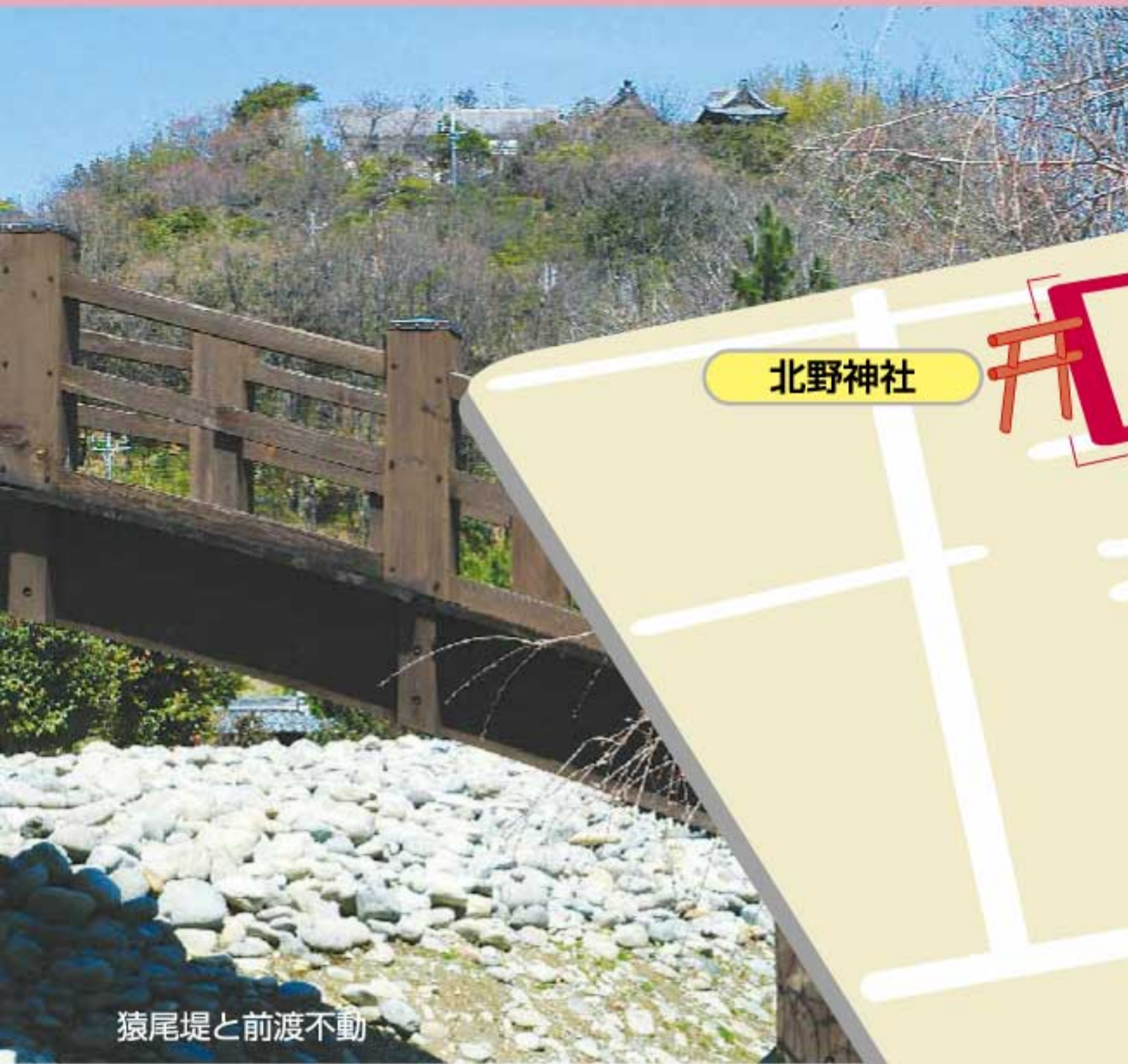
猿尾堤と前渡不動

前渡不動から見渡す木曾川の雄大な流れが、山登りの疲れを癒してくれるコース。標高87.5mの矢熊山は低山でありながら、濃尾平野の北辺にあって、南に眺望が開ける手軽なハイキングコースとして親しまれています。かつて眼下を流れていた木曾川旧流路を、前渡猿尾堤に偲ぶことができます。