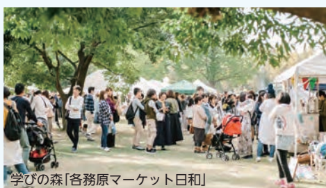
学びの森「各務原マーケット日和」