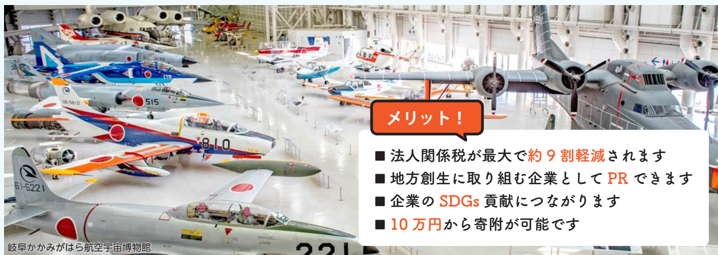
岐阜かみがはら航空宇宙博物館

岐阜県各務原市は、岐阜県南部に位置する人口約14万人の都市です。豊かな自然や賑わいのある観光資源に恵まれるとともに、県内随一のものづくり企業の集積を誇るなど、都市と自然が調和した、暮らしやすい街並みが形成されています。