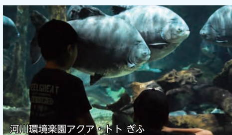
河川環境楽園アクア・トトぎふ