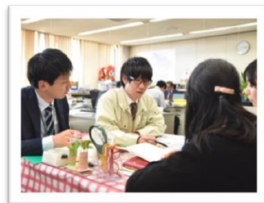
課内ミーティングでの1コマ