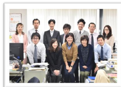
同じ職場の仲間との1枚 温かい雰囲気の中で仕事をしています