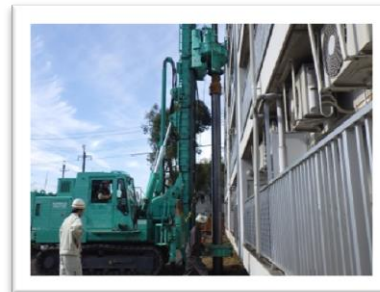
住宅の耐震補強工事の様子 命を守る責任のある仕事です