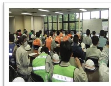
熊本地震の時は災害派遣職員として、 被災地で1週間ほど働きました