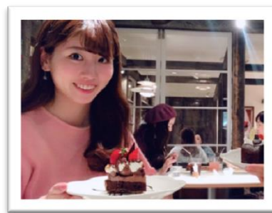
休日は友達とカフェでランチ♪