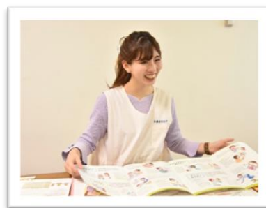
乳幼児健診では 子どもの笑顔に癒されます