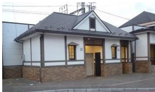
①各務原市役所前駅公衆トイレ

駅前公衆トイレ（3施設）は、名鉄各務原線や、JR高山本線、駅前バスの乗客等が利用するために設置されています。