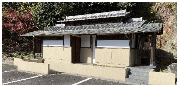
①前渡不動公衆便所