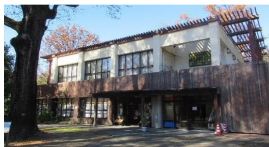
①各務原市那加福祉センター

各務原市福祉センター（13施設）は、市民の福祉増進、文化生活の普及及びコミュニティ活動の促進を図ることを目的として設置された施設です。