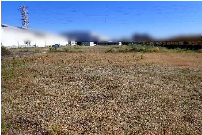
敷地北側から南向きに撮影 令和8年5月29日撮影