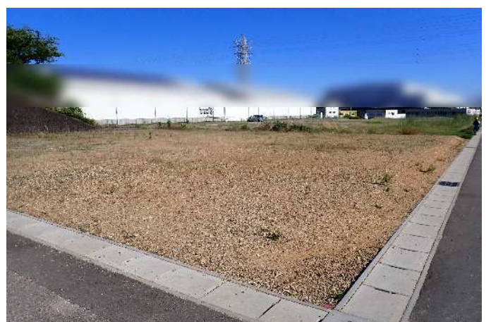
敷地北西側から南東向きに撮影 令和8年5月29日撮影