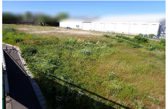
敷地南側から北東向きに撮影 令和8年5月29日撮影