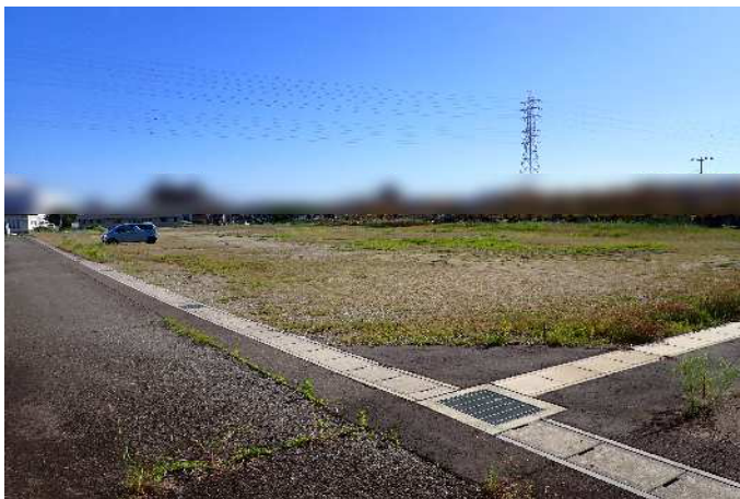
敷地北東側から南西向きに撮影 令和8年5月29日撮影