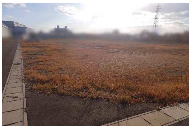
敷地北東側から南西向きに撮影 令和7年11月28日撮影