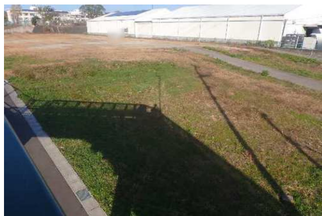
敷地南側から北東向きに撮影 令和7年11月28日撮影