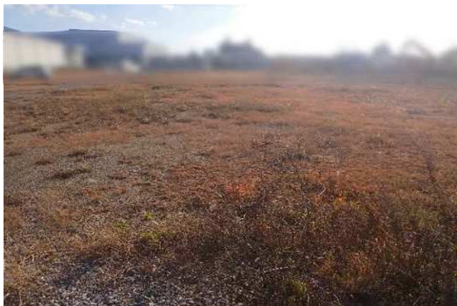
敷地北側から南向きに撮影 令和7年11月28日撮影