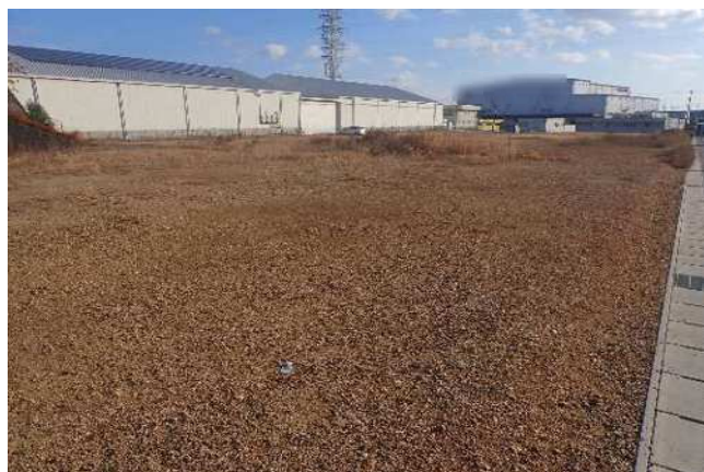
敷地北西側から南東向きに撮影 令和7年11月28日撮影