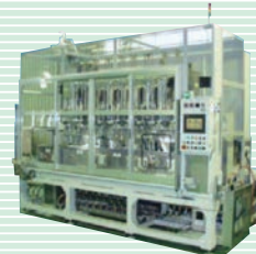
全自動型 電解バリ取り機