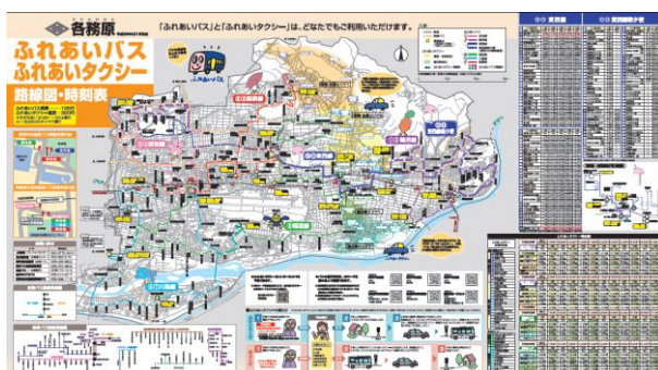
ふれあいバスマップ (H29.4.1 改正版)