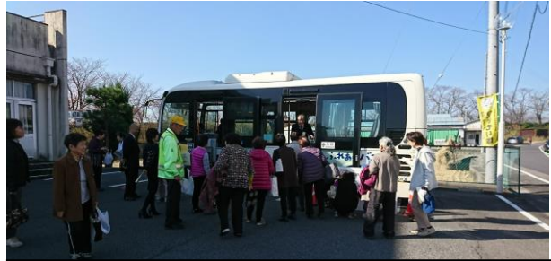
稲羽コミュニティセンターでの開催の様子