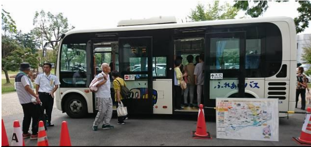
鵜沼福祉センターでの開催の様子