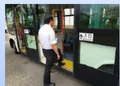
①後方ドアから乗車