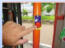
③停留所が近づいたら ボタンを押す