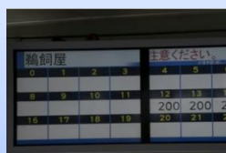
④整理券の番号と モニターで運賃を確認