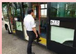
①後方ドアから乗車