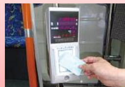
②カードを 機械にタッチ