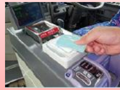
④運転席横の 機械にタッチ