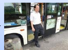
⑤前方ドアから降車