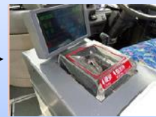
⑤おつりのないよう 現金を運賃箱へ