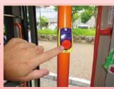
③停留所が近づいたら ボタンを押す