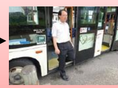
⑤前方ドアから降車