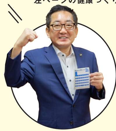
各務原市長 浅野健司