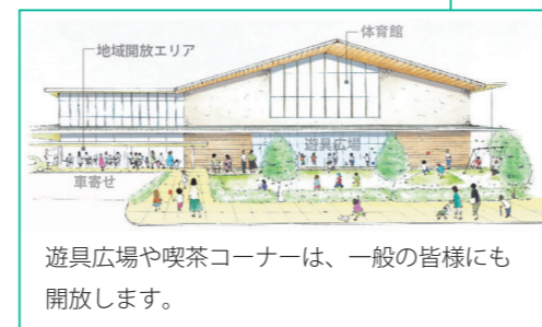
遊具広場や喫茶コーナーは、一般の皆様にも開放します。